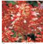
Red And White