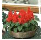
Red Hot Sally II