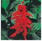
Red Hot Sally II