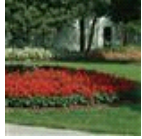
Red Hot Sally II