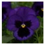
Blue Blotch Improved