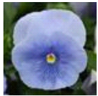
Pure Silver Azure