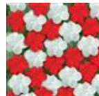
Red White Mixture