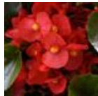
Red Green Leaf