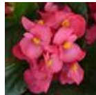
Rose Green Leaf