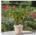
Hot Lemon Zest