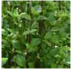
Everleaf Thai Towers