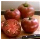
Heirloom Marriage Cherokee Carbon