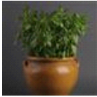
Sweet Dani Lemon