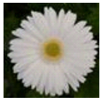
White with Light Eye