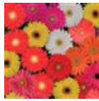
Select Mixture Improved