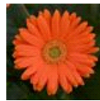
Orange with Light Eye