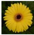
Yellow with Dark Eye