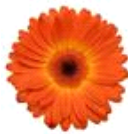
Bicolor Yellow Orange