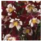
Burgundy And White