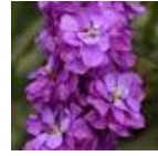
Miracle Blue Mid