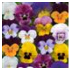
Spring Select Mixture