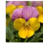
Yellow Pink Jump Up