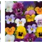
Spring Select Mixture