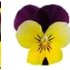
Yellow Jump Up