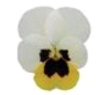
Lemon Ice Blotch