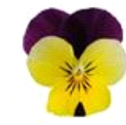
Yellow Jump Up