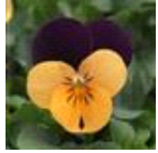
Orange Jump Up Improved