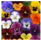
Autumn Select Mixture