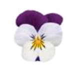
White Jump Up