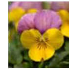
Yellow Pink Jump Up