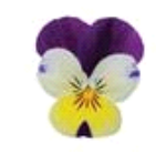
Lemon Jump Up