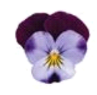
Denim Jump Up