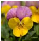
Yellow Pink Jump Up