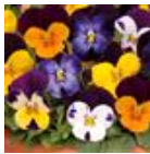
Jump Up Mixture