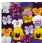
Spring Select Mixture