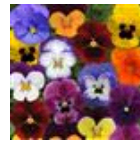
Autumn Select Mixture