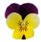
Yellow Jump Up