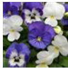
Blueberry Sundae Mixture