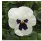
White Blotch Improved