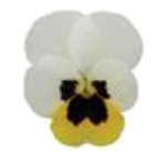
Lemon Ice Blotch