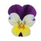
Lemon Jump Up