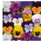
Spring Select Mixture