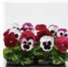
Raspberry Sundae Mixture