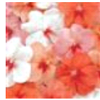
Tutti Frutti Mixture