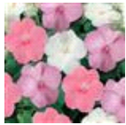
Baby Shower Mixture