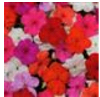
Grower Select Mixture