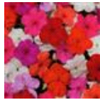
Grower Select Mixture