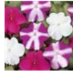
Violet Star Blend