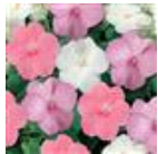
Baby Shower Mixture