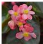
Pink Bronze Leaf