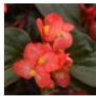
Red Bronze Leaf