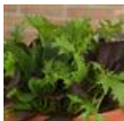
Pro San Mixture