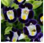
Blue & White