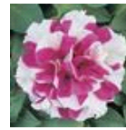
Rose And White