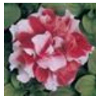
Red And White