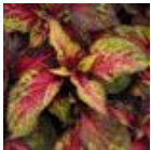
Rose to Lime Magic