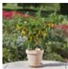
Hot Lemon Zest