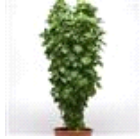
Everleaf Thai Towers