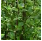
Everleaf Thai Towers