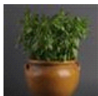
Sweet Dani Lemon