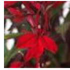
Scarlet Bronze Leaf