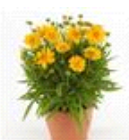
Double the Sun