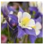
Blue And White