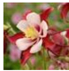
Red And White