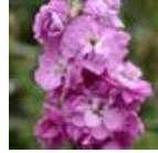
Ball Pink No 22