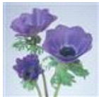
Deep Blue Improved