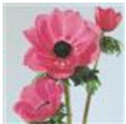
Orchid Shades Improved