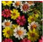
Raspberry Lemonade Mixture