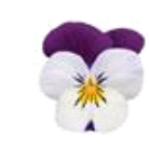
White Jump Up