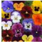
Autumn Select Mixture