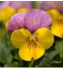
Yellow Pink Jump Up