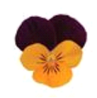
Orange Jump Up