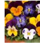
Jump Up Mixture