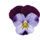
Denim Jump Up