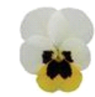
Lemon Ice Blotch