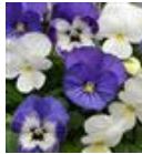
Blueberry Sundae Mixture