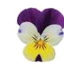
Lemon Jump Up