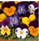
Jump Up Mixture