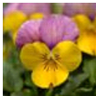
Yellow Pink Jump Up