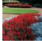
Red Hot Sally II