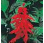
Red Hot Sally II