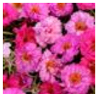
Pink Passion Mixture