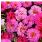
Pink Passion Mixture