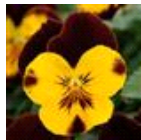
Sunshine 'N Wine