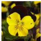
Red Wing Improved