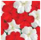
Red White Mixture