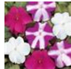
Violet Star Blend