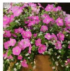
Silk N' Satin