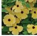
Yellow with Eye