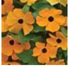
Orange with Eye