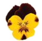
Sunshine 'N Wine