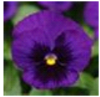
Deep Blue Blotch