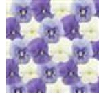
Baby Boy Mixture