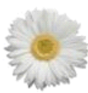
White with Light Eye